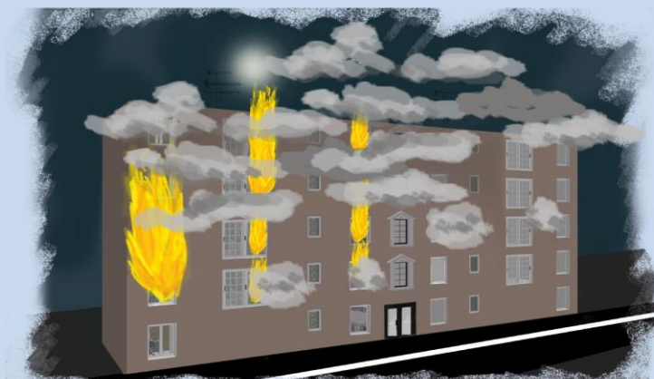
Planche réalisée par le service communication

Le couple fuit en ne fermant aucune porte. Pensant qu'il faut évacuer tout l'immeuble, il frappe à la porte de son voisin de palier, puis monte au 2 ème étage mais les fumées envahissent rapidement la cage d'escalier en bois. Paul doit rebrousser chemin pour sortir de l'immeuble.